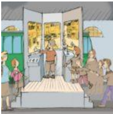
Vision Fahrsimulator im Tram-Museum

Ziel des Projektes ist, die vorhandene reichhaltige Sammlung historisch wertvoller Trams der Öffentlichkeit zugänglich zu machen. In einer spannenden und interaktiven Ausstellung soll die Geschichte des Basler Trams und damit auch ein bedeutender Teil der jüngsten Stadt- und Wirtschaftsgeschichte lebendig und interessant dem Besucher nähergebracht werden.