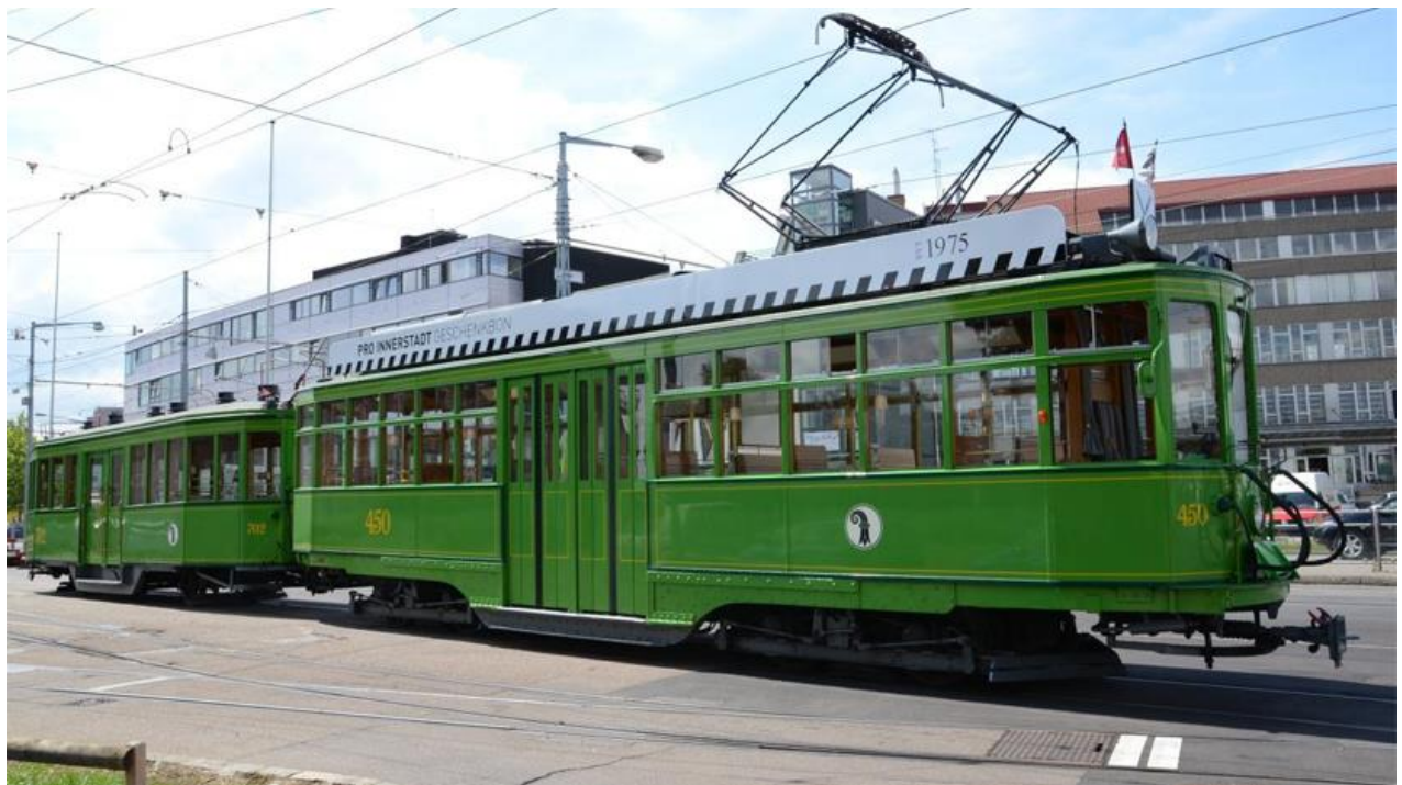
Das über 100 Jahre alte Restaurant-Tram «Dante Schuggi» steht als Synonym für die Basler Oldtimer-Trams

Zuverlässig wecken die Oldtimer-Trams, wenn sie auf ihren Extrafahrten im alltäglichen Stadtbild für einen kurzen Moment in der Öffentlichkeit erscheinen, persönliche Erinnerungen und ein bisschen Sehnsucht nach vergangenen Zeiten.